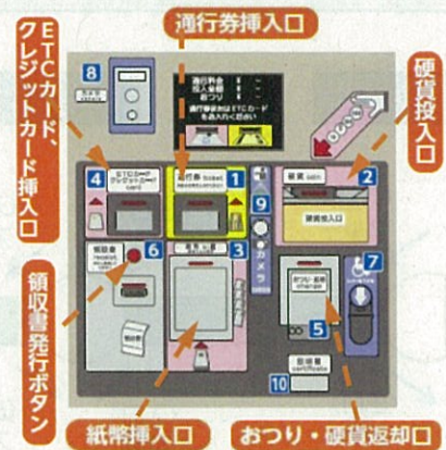
料金精算機(全面パネル)