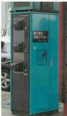
通行券自動発行機