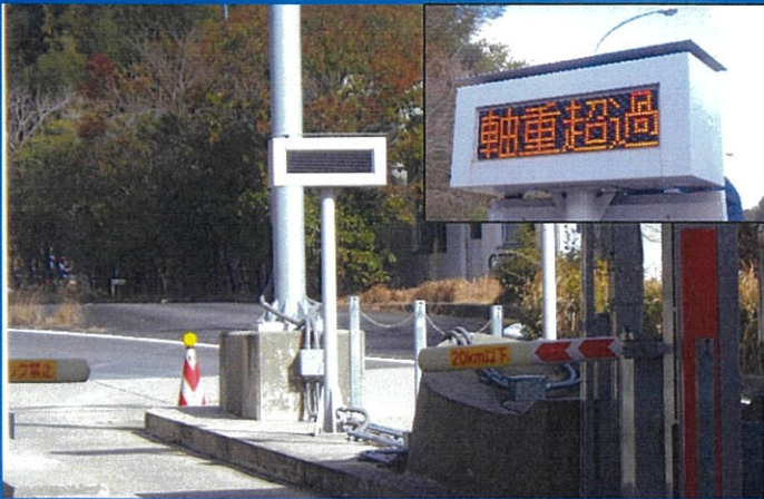
料金所での「軸重超過」表示